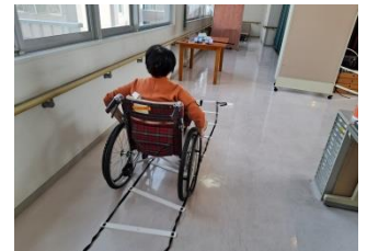
車椅子駆動練習の様子

自宅内での移動は車椅子となるため小さい段差や絨毯でも車椅子で駆動できるように障害物を車椅子で駆動する練習も行っています。