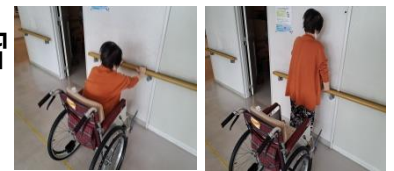
自主訓練時の様子

リハビリ以外の時間もフロアにある手すりを使用して自主的に立ち上がり訓練を行っており、日ごろから運動する習慣をつけています。