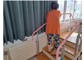
階段昇降時の様子

入所中の〇様の在宅前には5段の階段があり、上らないと自宅に帰るのは大変です。そこでリハビリでは自宅前の階段を想定しての階段昇降を行っています。同じ手すりの位置、上る際の足の位置などを伝えながら行っています。